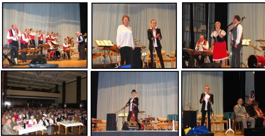
Fotografie z akce Dechovka a kouzelník 20. 11. 2015 Dělnický dům Studénka

Tento projekt byl realizován v rámci našeho projektového programu „02 Podpora pro seniory“ s cílem zajistit kulturní vyžití občanům vyššího věku ze Studénky, ale nemohli jsme ani opomenout pozvat na tuto kulturní akci také seniory ze zdejší Charity a ze Seniorcentra Oasa, s. r. o. , které má své sídlo v obci Petřvaldík, poblíž Nového Jičína. Celé akce se zúčastnilo cca. 200 účastníků.